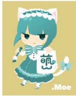
すーびっくきゅーぶ